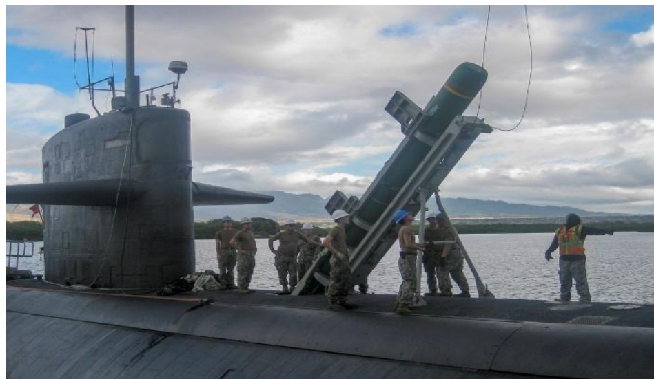
Gambar 3.3. USS Olympia loading UGM-84 Harpoon