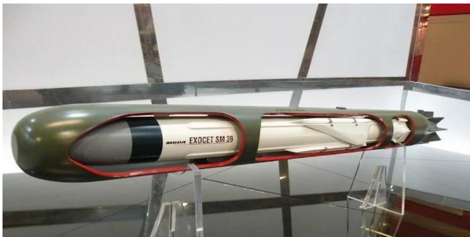
Gambar 3.6. Rudal SM-39 Exocet

para expert diperoleh tiga alternatif pemilihan Sub launch missile sebagai kapal selam tetap tersembunyi dan meningkatkan survivabilitas. Rudal ini efektif dalam berbagai kondisi cuaca dan memiliki kemampuan anti-jamming yang tinggi. Selain itu, Profil sea-skimming membuat rudal sulit dideteksi dan dicegat oleh sistem pertahanan udara musuh.