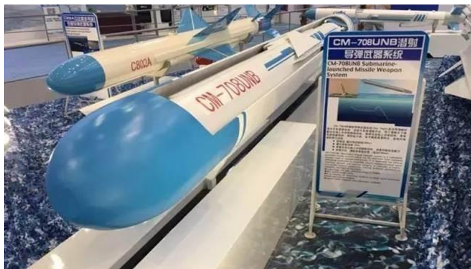
Gambar 3.8. Rudal CM-708UNB