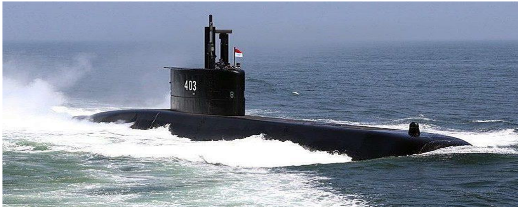
Gambar 3.1. Kapal Selam KRI Nagapasa-403

Ardedali-404, dan KRI Alugoro-405 yang dibuat melalui Transfer of Technology (ToT) pada saat pembuatan kapal selam yang ketiga melalui PT PAL. Kapal selam pertama dan kedua dalam batch kedua ini akan dibagi dua dalam pengerjaan modulnya. Pada kapal pertama Indonesia mengerjakan 4 modul sedangkan Korea 2 modul, nantinya kapal akan dirakit di Korea Selatan. Pada kapal kedua masih sama, Indonesia membuat 4 modul dan Korea membuat 2 modul, kapal ini juga akan dirakit di Korea Selatan. Sementara kapal terakhir, seluruh modulnya akan dibuat oleh Indonesia dan kapal selam akan dirakit oleh PT PAL.