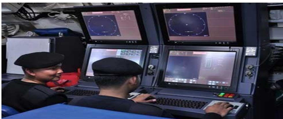
Gambar 3.2. CMS MSI-90U Mk 2 di KRI Nanggala 402

Kapal selam Changbogo Class adalah kapal selam yang memiliki spesifikasi yang tinggi, termasuk kemampuan menyelam ke kedalaman 250 meter dengan cepat maksimal 21 knot pada saat menyelam yang dapat membuat kapal selam ini susah dideteksi oleh sensor kapal permukaan. Kapal selam ini mampu beroperasi secara terus-menerus selama 50 hari dengan menggunakan baterai buatan Korea Selatan sebagai sumber tenaga. Kapal selam ini juga dipersenjatai dengan 8 tabung torpedo yang dapat meluncurkan torpedo heavy weight Tipe black shark berukuran 533 mm yang mampu menenggelamkan kapal permukaan dan kapal selam. Kapal selam ini juga bisa dilengkapi rudal anti-kapal permukaan.