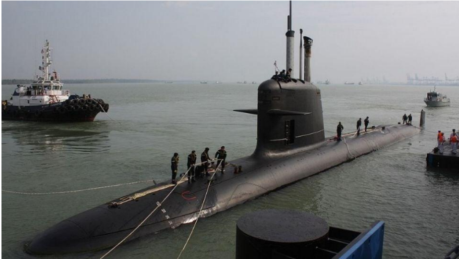
Gambar 3.4. Kapal Selam KD Tunku Abdul Rahman