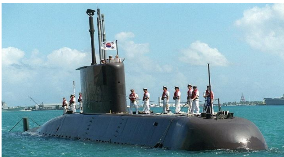
Gambar 3.5. Kapal Selam Changbogo Class Na Daeyong (SS-069)

Rudal SM39 Exocet digunakan pada berbagai kapal selam kelas Scorpene, Agosta, Amethyste, Barracuda, dan Le Triomphant, serta kapal selam lain yang dilengkapi sistem peluncuran torpedo standar 533 mm. Rudal ini telah digunakan secara luas oleh beberapa angkatan laut di dunia dan dikenal sebagai senjata anti-kapal yang sangat efektif dan andal sejak tahun 1980-an. Peluncuran dari bawah air memungkinkan kapal selam menyerang sasaran permukaan tanpa harus muncul ke permukaan, menjaga posisi