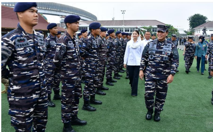
Gambar 2. KRI Bima Suci dilepas oleh Kepala Staf TNI AL Laksamana Muhammad Ali.

Pada 15 April 2026, Satlat KJK Taruna Akademi Angkatan Laut (AAL) Angkatan ke-73 tahun 2026 dan delegasi ASEAN Plus Cadet Sail (APCS) yang on board di KRI Bima Suci setelah melaksanakan pelayaran selama 7 hari dari Belawan, Medan, akhirnya tiba di etape ke-3, yaitu Colombo, Sri Lanka, dan sandar di Dermaga Bandaranaike Quay 2, Sri Lanka.