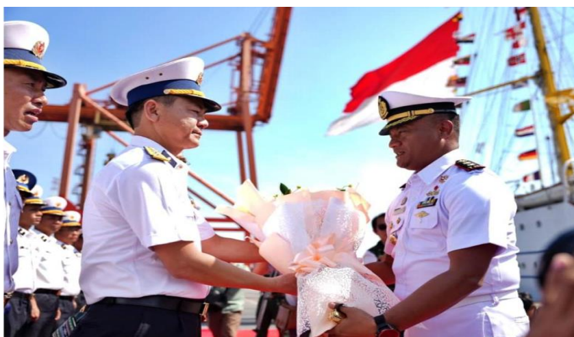
Gambar 5. Sandar di Ho Chi Minh City, Vietnam