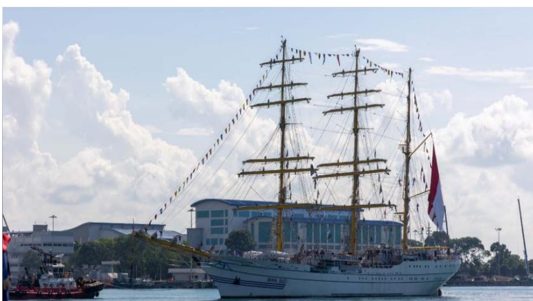
Gambar 4. Satlat KJK Taruna AAL Sandar di Changi Naval Base, Singapura

Pada Etape 4, KRI Bima Suci, yang membawa Satgas Lattek Kartika Jala Krida (KJK) 2026 Taruna Akademi Angkatan Laut (AAL) Angkatan ke-73, melaksanakan kunjungan persahabatan di Singapura sebagai bagian dari misi pelayaran muhibah diplomasi ke sejumlah negara di kawasan Asia dan Eropa.