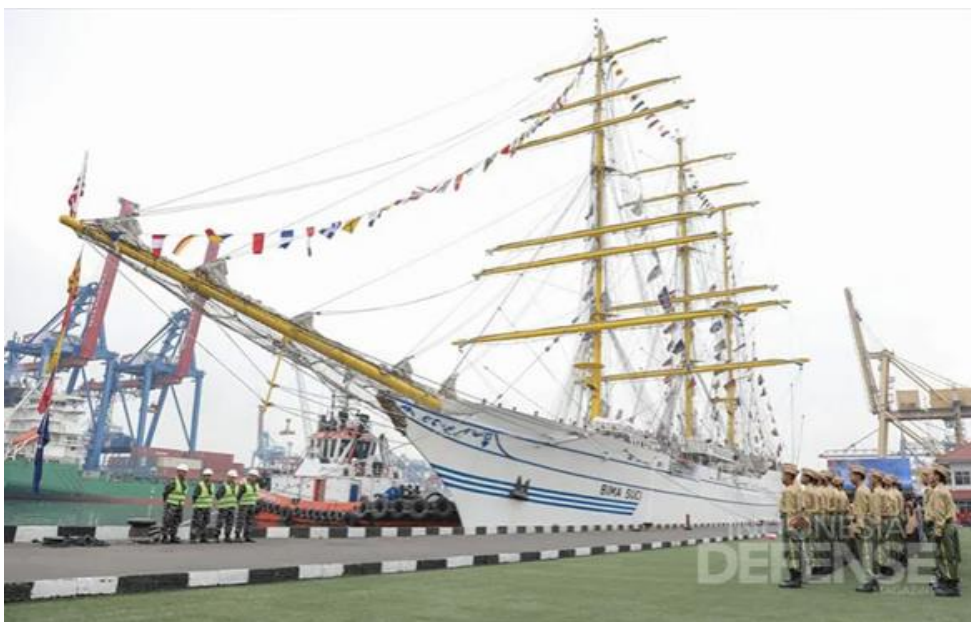
Gambar 1. KRI Bima Suci bersandar di Dermaga Kolinlamil.

Pada Selasa, 31 Maret 2026, KRI Bima Suci telah menyelesaikan pelayaran etape I dari Surabaya ke Jakarta. Setibanya di Dermaga Komando Lintas Laut Militer (Kolinlamil), Jakarta Utara, KRI Bima Suci dilepas oleh Kepala Staf TNI AL (KSAL) Laksamana Muhammad Ali.