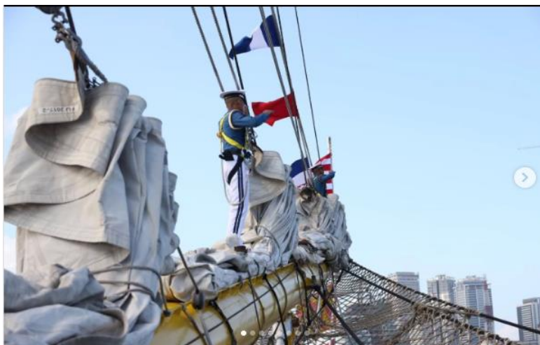
Gambar 3. Satlat KJK Taruna AAL Sandar di Colombo, Sri Lanka

Pada Etape 4, KRI Bima Suci, yang membawa Satgas Lattek Kartika Jala Krida (KJK) 2026 Taruna Akademi Angkatan Laut (AAL) Angkatan ke-73, melaksanakan kunjungan persahabatan di Singapura sebagai bagian dari misi pelayaran muhibah diplomasi ke sejumlah negara di kawasan Asia dan Eropa.