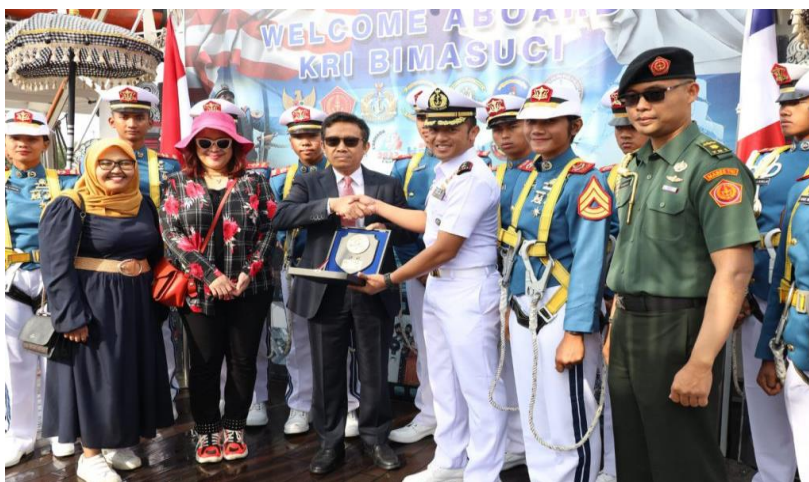
Gambar 3: Pemberian Cenderamata ke Staf Kordinator Fungsi Politik KBRI Perancis

membuat Masyarakat Rouen semakin takjub menyaksikan Parade Roll di tiang-tiang tinggi KRI Bima Suci dan sebagian Taruna melambaikan tangan perpisahan sembari menggunakan berbagai macam pakaian adat bangsa Indonesia. (AAL, 2023c)