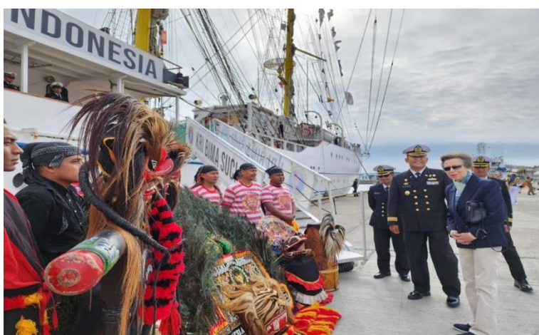
Gambar 8: Princes Anne, Princess Royal British mengunjungi KRI Bima Suci

Satuan Tugas Misi Pelayaran Diplomasi dan Duta Bangsa Satgas KJK 2023, menuai pujian Princess Anne, Princess Royal British. Putri Kerajaan Inggris Raya ini mengunjungi KRI Bima Suci pada event bergengsi kapal layar internasional Tall Ship Race 2023 di Port Holmsgrat pier no.5, Lerwick, Skotlandia, pada Jumat 28 Juli 2023. Kunjungan Princess Anne ke KRI Bima Suci merupakan salah satu rangkaian kunjungannya ke Lerwick dalam rangka meninjau langsung pelaksanaan Tall Ship Race 2023. (Indonesian Maritim News, 2023)