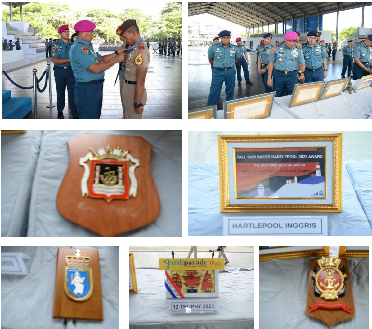
Gambar 13 Upacara Penyambutan Kedatangan Satlat KJK dan Trophy yang diperoleh

Gubernur AAL dalam sambutannya bangga dan berterima kasih kepada Satlat KJK Taruna AAL tahun 2023 karena telah mampu melaksanakan Latihan KJK dengan aman, lancar dan sukses. Satlat KJK Taruna AAL tahun 2023 telah membuktikan mampu melaksanakan tugas dan misi pelayaran dengan baik, bahkan telah berhasil mengikuti dan memenangkan beberapa pertandingan.