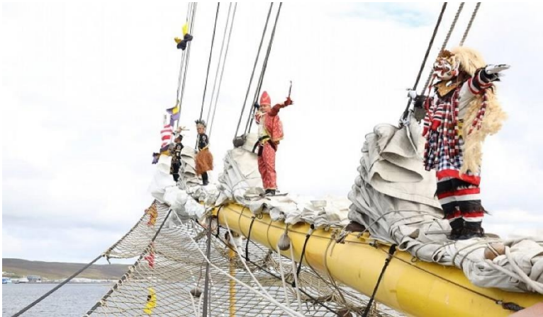
Gambar 10. Performance Taruna saat mau sandar di dermaga Port of Lerwick, Skotlandia

Dua belas tropy pada event bergengsi internasional Tall Ship Races Sail 2023 resmi digenggam TNI Angkatan Laut persembahkan dari KRI Bima Suci dan Taruna AAL yang tergabung sebagai Satgas misi pelayaran diplomasi dan duta KJK setelah berhasil menyelesaikan race terakhir di Arendal, Norwegia, pada Jumat 4 Agustus 2023.