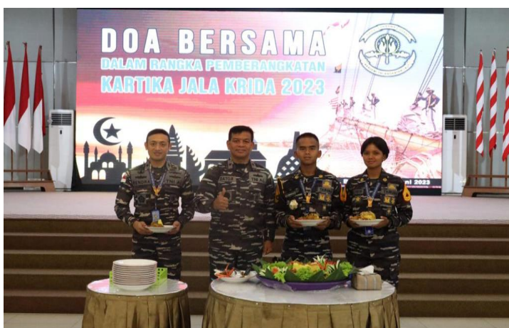
Gambar 1: Acara Keberangkatan KJK

Latihan praktek KJK 2023 bertujuan untuk memberikan pengetahuan dan kecakapan sebagai bekal awal menjadi perwira TNI AL sekaligus pembentukan karakter prajurit matra laut. Selain itu latihan ini merupakan wujud peran diplomasi TNI AL dalam menunjukkan bahwa bangsa Indonesia adalah bangsa bahari berwawasan maritim ke dunia internasional. Pesan Gubernur AAL kepada Taruna peserta KJK 2023 agar senantiasa menjalin hubungan baik dengan penuh persahabatan terhadap masyarakat nasional dan internasional khususnya kepada para komunitas pelaut dunia dalam semangat Seaman Brotherhood. (AAL, 2023b)