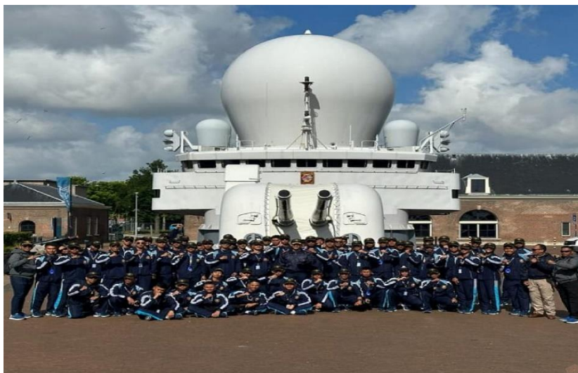
Gambar 7: Navy Museum di Inggris