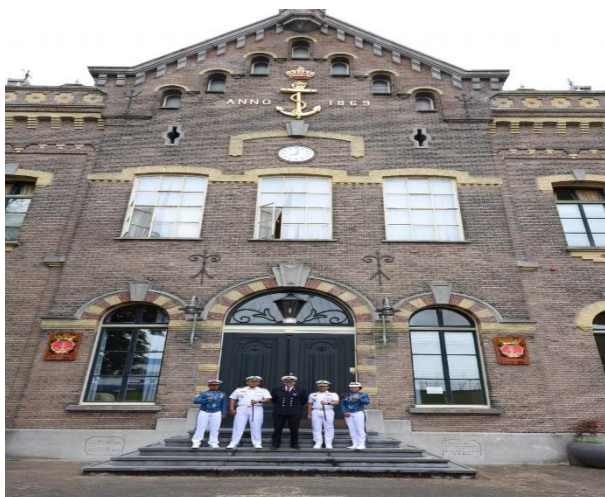
Gambar 5: Royal Naval College

Nederlandse Defensie Academie ini menawarkan program empat atau lima tahun dan juga kursus singkat dari 16 sampai 22 bulan dan setelah menyelesaikan program lulusan diberikan gelar sarjana dan ditugaskan di Angkatan Laut Kerajaan Belanda.