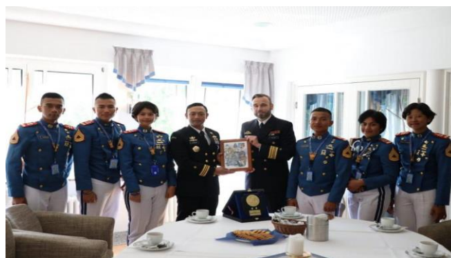
Gambar 12 Pemberian Cenderamata kepada Komandan Naval Base Warnemunde Jerman

Lattek KJK juga memiliki peran Diplomatik, hal tersebut dalam upaya memperkuat Poros Maritim Dunia (PMD). Para Taruna AAL saat melaksanakan lattek pelayaran muhibah luar negeri sering kali menjadi duta dan perwakilan negara dalam berbagai forum Internasional yang membahas isu-isu Maritim. Mereka membawa pemahaman mendalam tentang hukum laut, keamanan Maritim dan kerjasama yang dapat berkontribusi pada kebijakan yang lebih baik dalam mendukung Poros Maritim Dunia. Sehingga peran AAL sangatlah penting dalam mewujudkan Poros Maritim Dunia melalui pendidikan, pelatihan, kolaborasi, inovasi teknologi serta diplomasi. Akademi TNI Angkatan Laut berkontribusi dalam menciptakan lingkungan Maritim yang aman, stabil, dan berkelanjutan dengan Angkatan Laut Jerman dalam mendukung perdamaian, perdagangan dan kerjasama Internasional