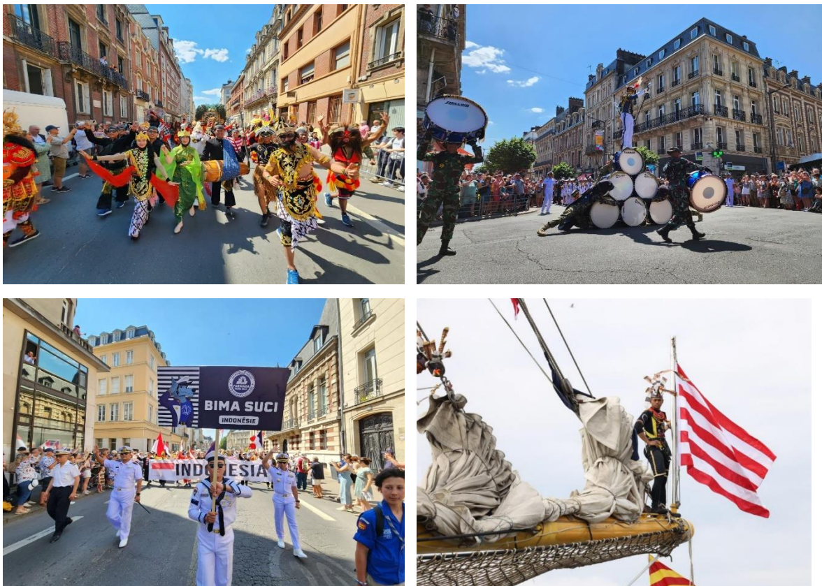
Gambar 2: Taruna AAL beraksi di L'Armada Rouen 2023

Di Rouen ada kegiatan L'Armada 2023, yaitu Taruna AAL menampilkan Tarian Nusantara diantaranya Tari Kecak, Tari Saman, Tari Rama Sinta, Tari Perang, serta Rampak Gendang yang dikolaborasikan dengan Band Taruna yang mengiringi Tarian tersebut. Tarian Nusantara yang dibawa Taruna AAL di Prancis, dipadati ribuan pengunjung L'Armada 2023 baik dari kalangan anak-anak hingga orang dewasa pada Sabtu 17 Juni 2023. Setiap hari pengunjung datang untuk menikmati keindahan dan menuntaskan rasa penasarannya akan Taruna Akademi Angkatan Laut (AAL) dalam rangka pelayaran muhibah Satuan Latihan Kartika (Satlak) Jala Krida 2023. (Indonesia, n.d.)